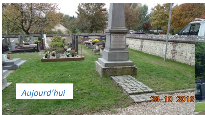
Préparation des sols avant engazonnement