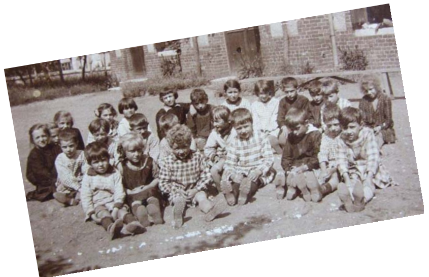
L'école autrefois (vers 1925)

L'équipe enseignante a le projet de travailler sur le thème du carnaval et souhaite organiser un petit défilé des élèves de l'école avec des masques faits de leurs mains. Cela viendra clôturer la période précédant les vacances d'hiver. Au mois de mai est prévue une sortie pédagogique sur le thème du cirque, un des sujets travaillés à l'école cette année.